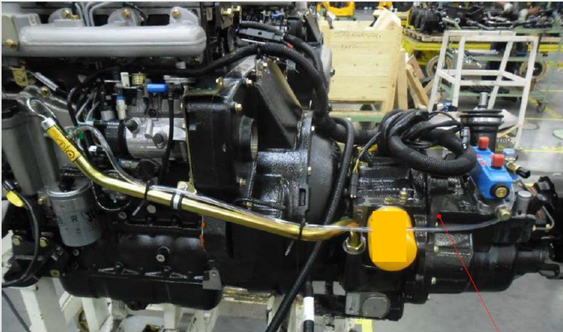
441/09007 Transmissão acoplada ao motor diesel

A caixa de engrenagens e transmissão semiautomática é aplicada em retroescavadeiras.